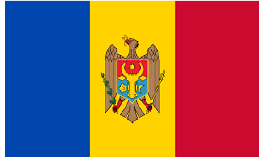
Молдова Интервенционный фонд